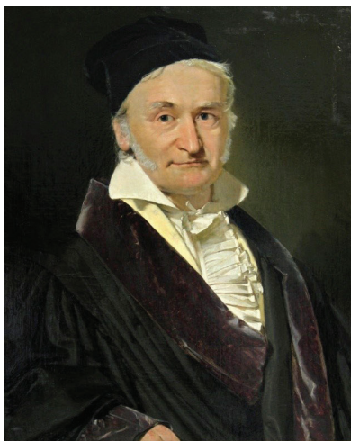
Figura 1. René Descartes (esquerda) e Carl Gauss, que deram contribuições importantes para o desenvolvimento da teoria dos números imaginários